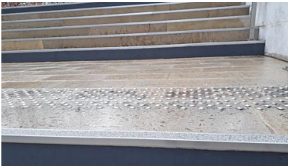
Autour de l'Hôtel de Ville, les escaliers extérieurs ont des nez de marches antidérapants et contrastés visuellement.

Mairie, maison de l'emploi, pôle cadre de vie et médiathèque, tous ces accueils ont une boucle à induction magnétique qui permet aux