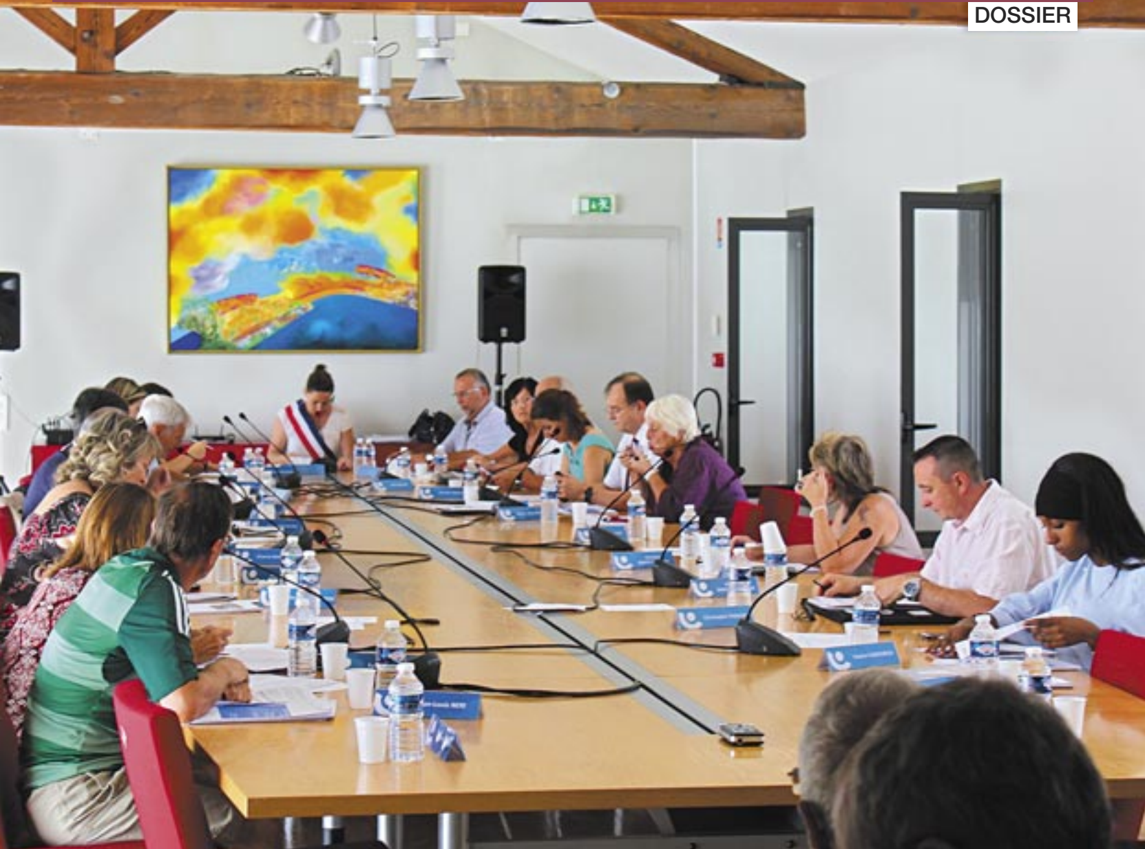
Chaque année, le budget de la Ville est voté par les élus.