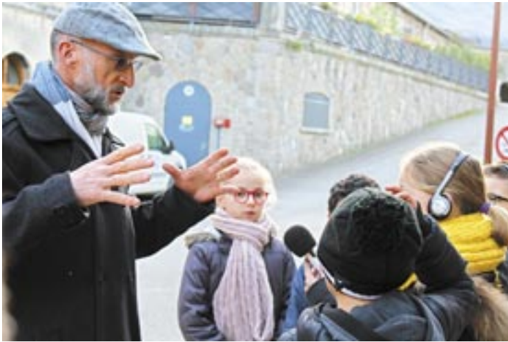
L'atelier "Théâtre du Fort" propose aux enfants de créer une pièce de théâtre sonore autour de l'histoire du Fort de Feyzin. Après avoir capté des bruits au sein de ce lieu, les enfants produiront une pièce de théâtre diffusée lors du Fort en Bal(!)ade.