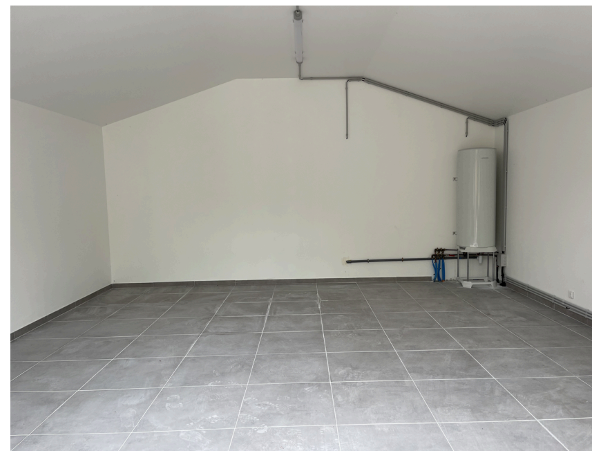
Espace de stockage