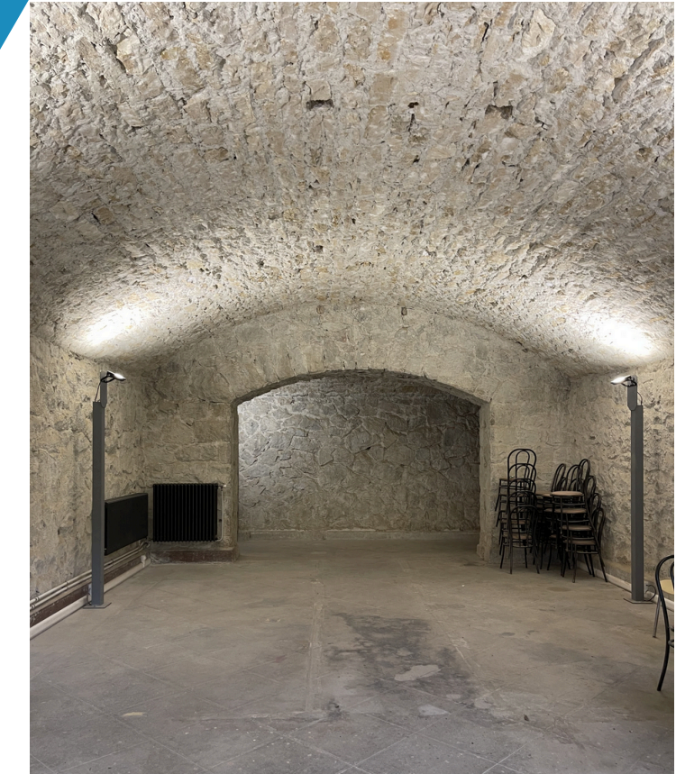
Salles de restauration